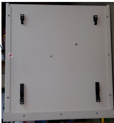
Рисунок 3 – Место пломбировки от несанкционированного доступа

Место пломбировки от несанкционированного доступа