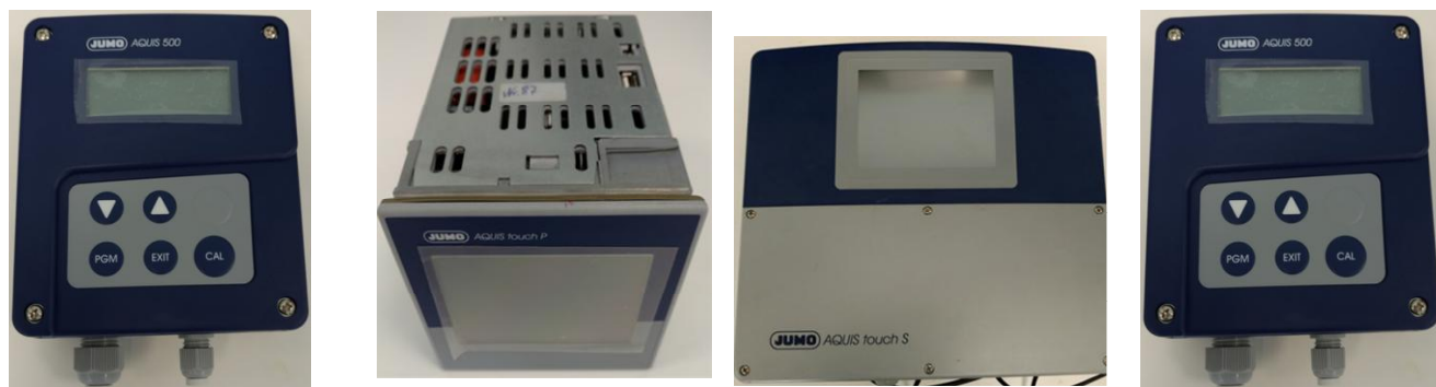
Анализатор жидкости промышленный серии AQUIS модификации AQUIS 500AS

Общий вид анализаторов жидкости промышленных серии AQUIS, модификаций AQUIS touch S, AQUIS touch P, AQUIS 500RS, AQUIS 500AS представлен на рисунке 1.