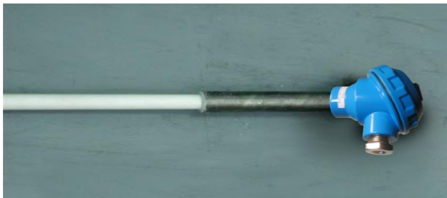
Рисунок 3 - Общий вид ТПР-11.200-12Д

Пломбирование термопреобразователей не предусмотрено