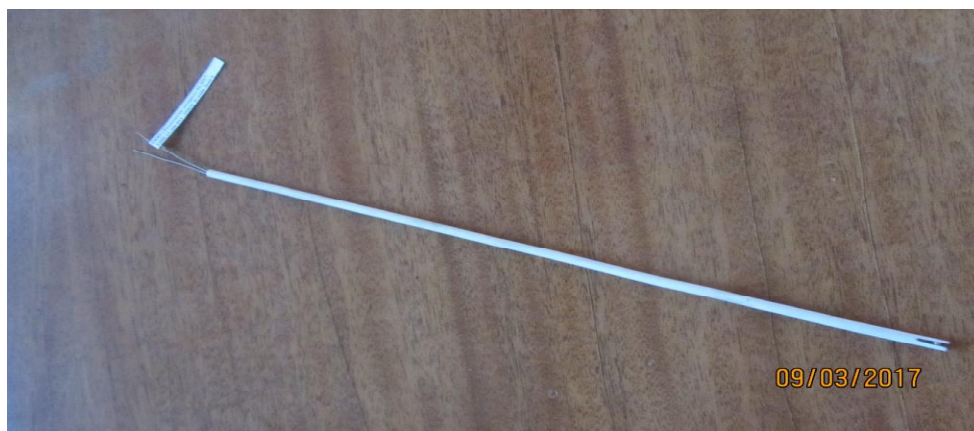
Рисунок 1 - Общий вид ТПП-11.200-013

Фотографии общего вида ТП представлены на рисунках 1, 2, 3.