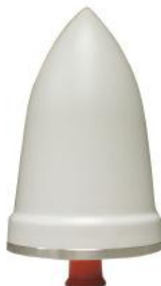
Рисунок 6 - Внешний вид антенны M104

«Пломбирование антенны GPSGL-TMG-SPI-40NCB не предусмотрено»