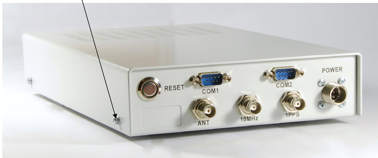
Рисунок 3 - Внешний вид задней панели АЧВС СН-5834М

Место пломбировки от несанкционированного доступа