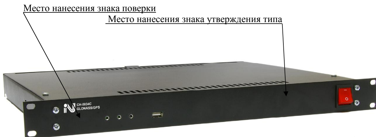
Рисунок 4 - Внешний вид передней панели АЧВС СН-5834С

Место пломбировки от несанкционированного доступа