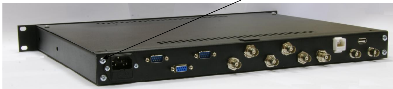
Рисунок 5 - Внешний вид задней панели АЧВС СН-5834С

Место пломбировки от несанкционированного доступа