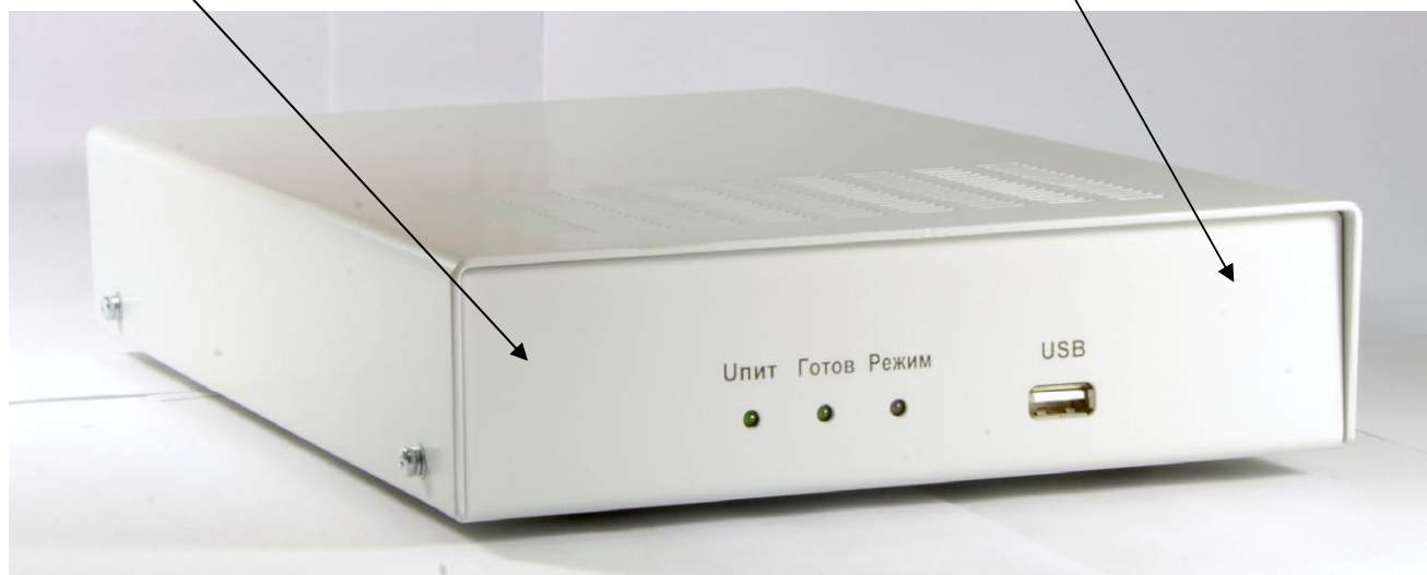
Рисунок 2 - Внешний вид передней панели АЧВС СН-5834М

Место пломбировки от несанкционированного доступа