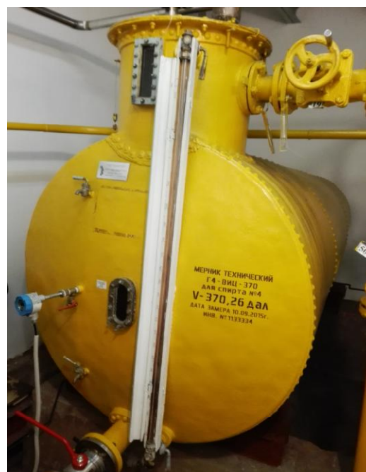
Рисунок 1 - Общий вид мерников Г4-ВИЦ-370, зав.№№ 5, 24