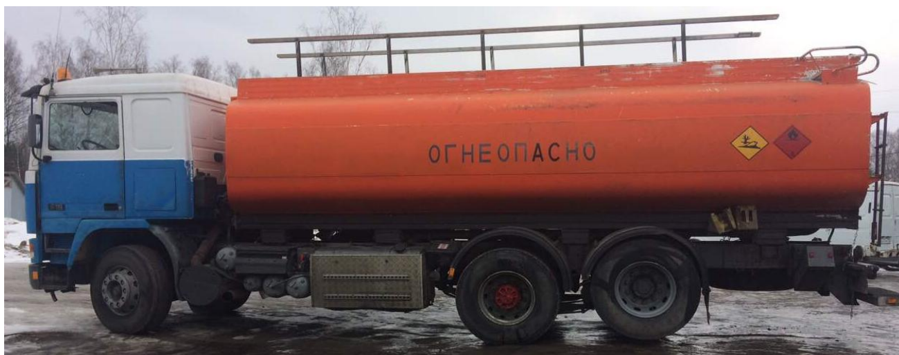
Рисунок 1 - Общий вид автоцистерны VOLVO F16 6X2

Схема пломбировки для защиты от несанкционированного изменения положения указателя уровня налива, обозначение места нанесения знака поверки представлены на рисунке 2.