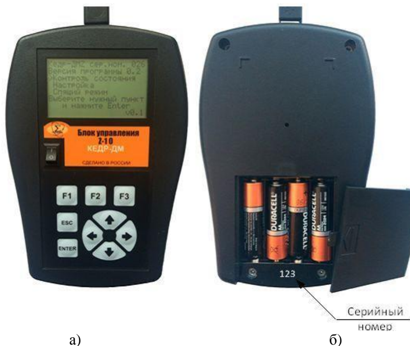
Рисунок 3 - Общий вид блока управления БУ Z-10: а) передняя панель, б) батарейный отсек

Уровнемер имеет 6 модификаций в зависимости от диапазона измерений эквивалентного уровня. Обозначение модификаций уровнемеров «КЕДР-ДМЗ» (LMZMMM) включено в обозначение датчиков гидростатического давления выносного устройства LMZ, где . MMM - эквивалентный диапазон измерения уровня воды 010, 024, 058, 127, 196 или 334 м и указывается при заказе.