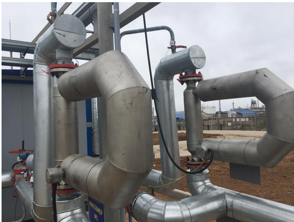
Рисунок 1 – Общий вид счетчиков-расходомеров