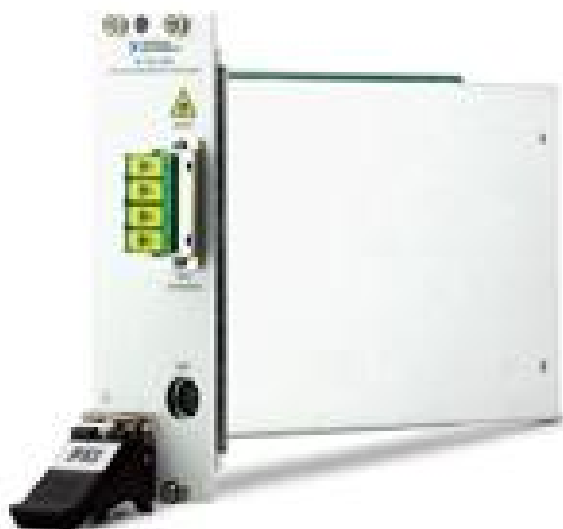
Рисунок 3 - Интеррогатор NI PXIe - 4844

Пломбирование компонентов комплекса не предусмотрено.