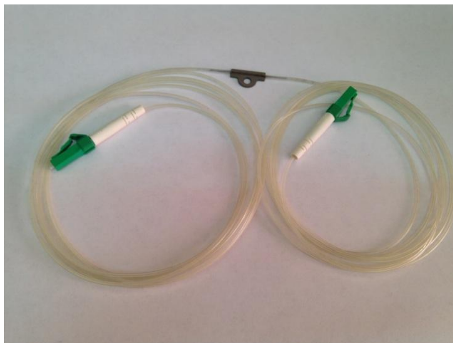
Рисунок 1 - Общий вид СЭД