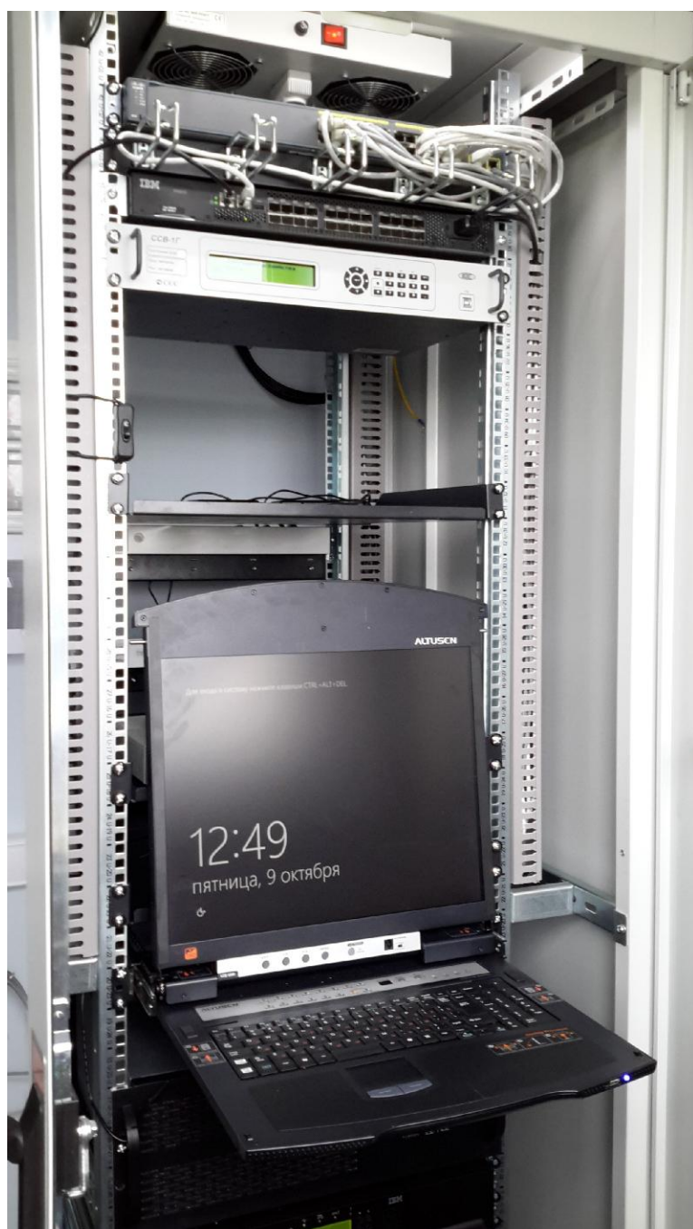
Рисунок 1 - Шкаф серверный

Общий вид ИВК ОАО «Газпром» приведен на рисунках 1 и 2.