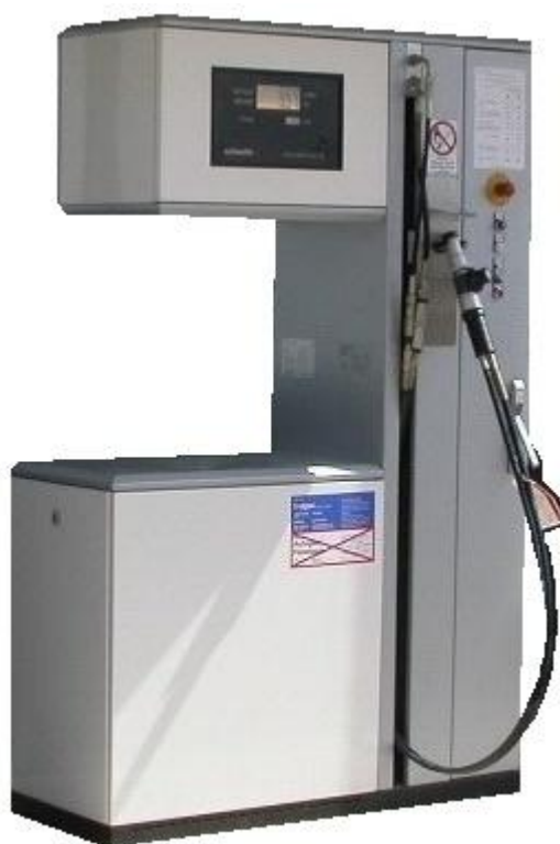
Рисунок 1 - Общий вид колонок

Схемы пломбировки от несанкционированного доступа, обозначение места нанесения знака поверки представлены на рисунках 3 и 4.