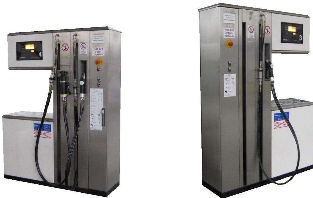
Рисунок 2 - Общий вид колонок