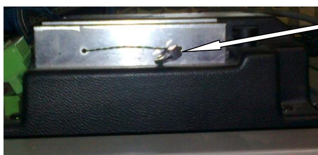
Рисунок 4 - Схема пломбирования электронно-вычислительного устройства WWC от несанкционированного доступа, обозначение места нанесения знака поверки