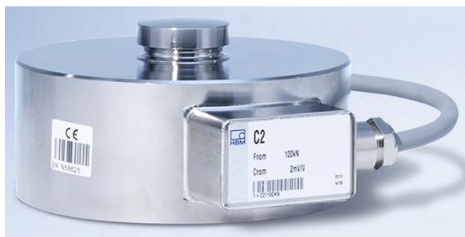
Рисунок 1 - Внешний вид датчиков C2[X]

Внешний вид датчиков представлен на рисунках 1 - 6.