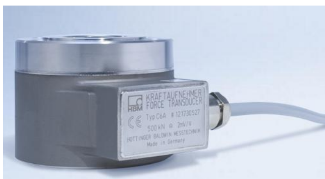
Рисунок 5 - Внешний вид датчиков C6[X]