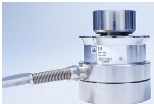
Рисунок 4 - Внешний вид датчиков C18[X]