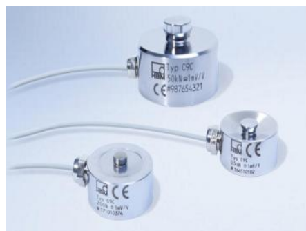
Рисунок 2 - Внешний вид датчиков C9[X]