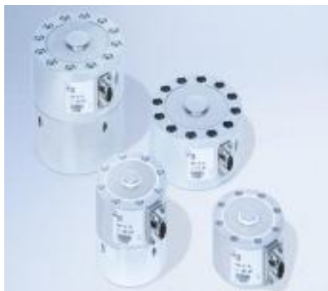
Рисунок 3 - Внешний вид датчиков C10[X]