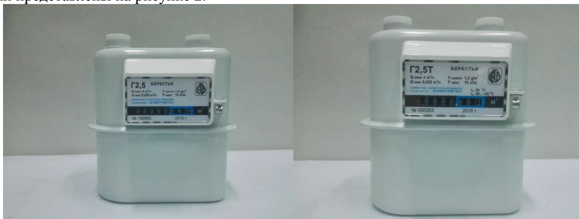
Рисунок 1 - Общий вид счетчиков

Схема пломбировки от несанкционированного доступа, обозначение места несения знака поверки представлены на рисунке 2.