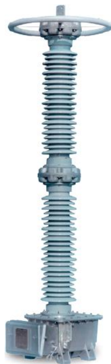
Рисунок 1 - Внешний вид средства измерений

Место пломбировки от несанкционированного доступа и обозначение места нанесения знака поверки представлены на рисунке 2.