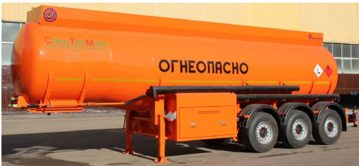
Рисунок 1 - Общий вид полуприцепа-цистерны БЦМ-180.3 модель 960512-0000010-03