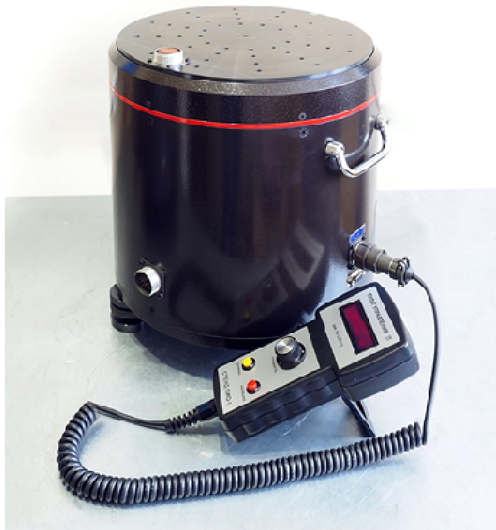
Рисунок 1 - Общий вид стенда

Общий вид стенда и схема пломбировки представлены на рисунках 1, 2а и 2б соответственно.