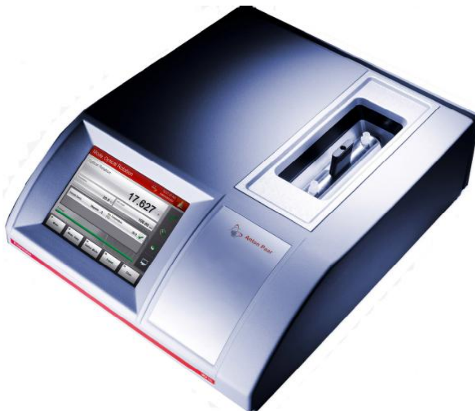
Рисунок 1 - Общий вид поляриметров автоматических цифровых МСР 150

Поляриметры состоят из следующих основных узлов: источника света (светодиод с длиной волны 589 нм), интерференционного светофильтра, поляризатора, измерительной камеры со встроенным цифровым термометром, анализатора, приемника излучения, а также системы электропитания. Все устройство смонтировано в едином корпусе. Управление прибором осуществляется с помощью сенсорного жидкокристаллического дисплея, на который так же выводится результат измерения УВП оптически активного образца, помещенного в измерительную камеру.