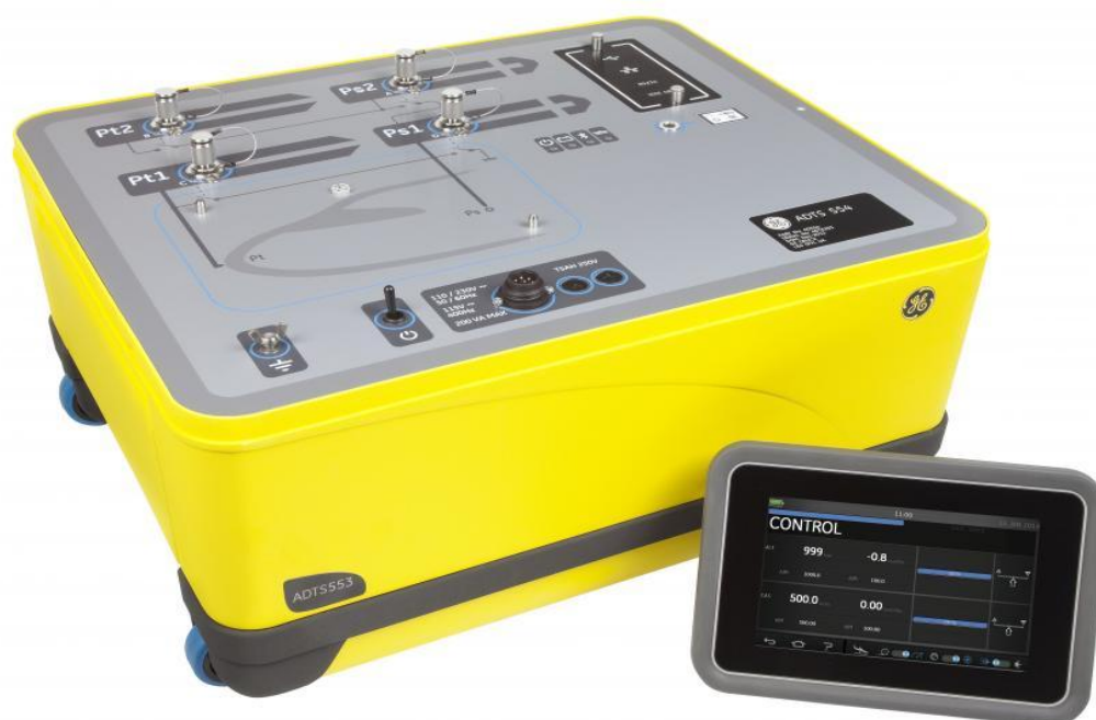
Рисунок 7 Прибор цифровой для проверки систем воздушных сигналов ADTS, модификации ADTS 554F

Метрологические и технические характеристики приведены в таблице 3 и таблице 4.