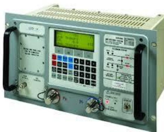
Рисунок 2 Прибор цифровой для проверки систем воздушных сигналов ADTS, модификации ADTS 405, ADTS 405 Mk2 панельной конструкции для установки в приборную стойку