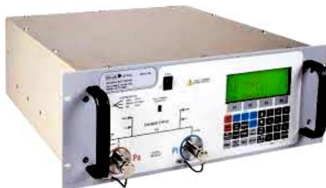
Рисунок 1 Прибор цифровой для проверки систем воздушных сигналов ADTS, модификации ADTS 403, ADTS 403 Mk2