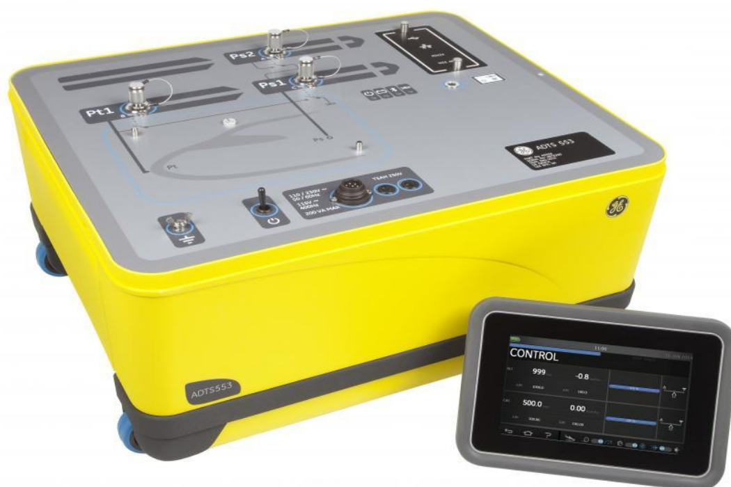
Рисунок 6 Прибор цифровой для проверки систем воздушных сигналов ADTS, модификации ADTS 553F