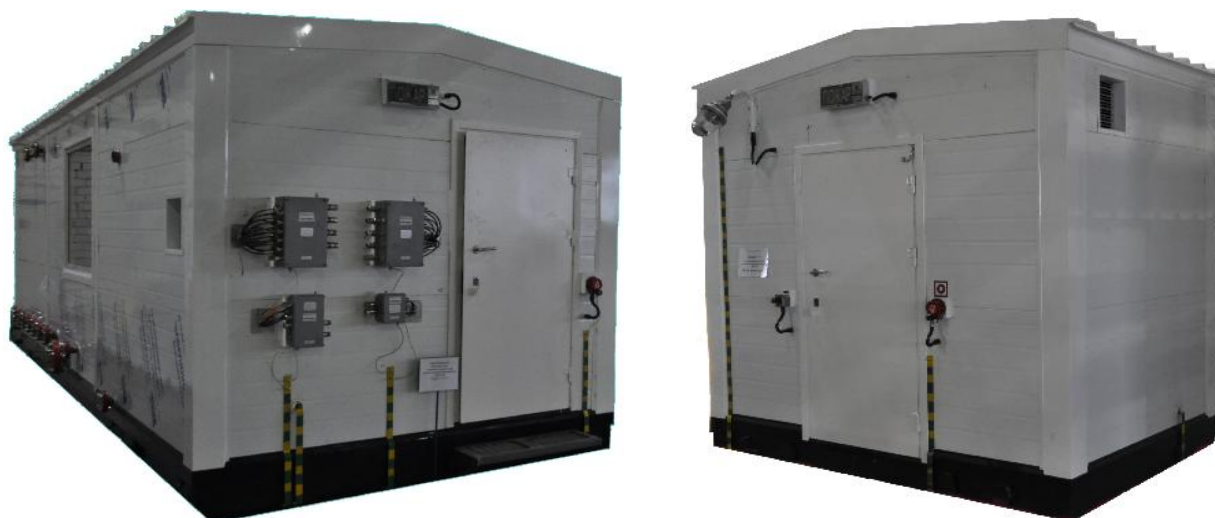
Рисунок 1 - Общий вид средства измерений

Схема пломбировки от несанкционированного доступа, обозначение места нанесения знака поверки представлены на рисунке 2.