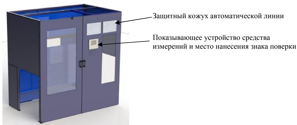
Рисунок 3 - Место нанесения знака поверки на средство измерений