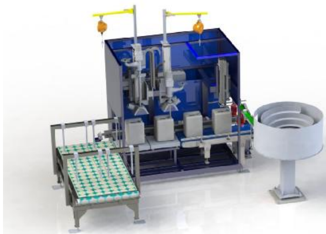
Рисунок 1 - Общий вид средства измерений (автоматическая линия, не показаны дверцы кожуха)

Схема пломбировки для защиты от несанкционированного доступа, обозначение места нанесения знака поверки представлены на рисунках 2 и 3.