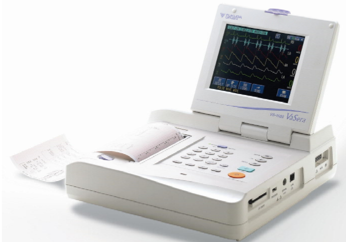
Рисунок 1 - Общий вид сфигмометра VS-1500N

Конструктивно сфигмометр состоит из основного блока, воздухопроводов и компрессионных манжет. Для визуализации измеряемых параметров сфигмометр снабжен поворачивающимся сенсорным дисплеем. В нише под дисплеем располагаются кнопка включения/выключения и другие функциональные клавиши. Для детализации измеряемых показателей и данных пациента сфигмометр снабжен встроенным термопринтером, который обеспечивает распечатку на миллиметровой бумаге. Воздуховоды и манжеты представляют собой резиновые шланги и пневмокамеры с застежкой типа «липучка» для фиксации на конечности. Общий вид сфигмометра представлен на рисунке 1. На рисунках 2 и 3 показаны задняя панель и место установки пломбы от несанкционированного доступа.