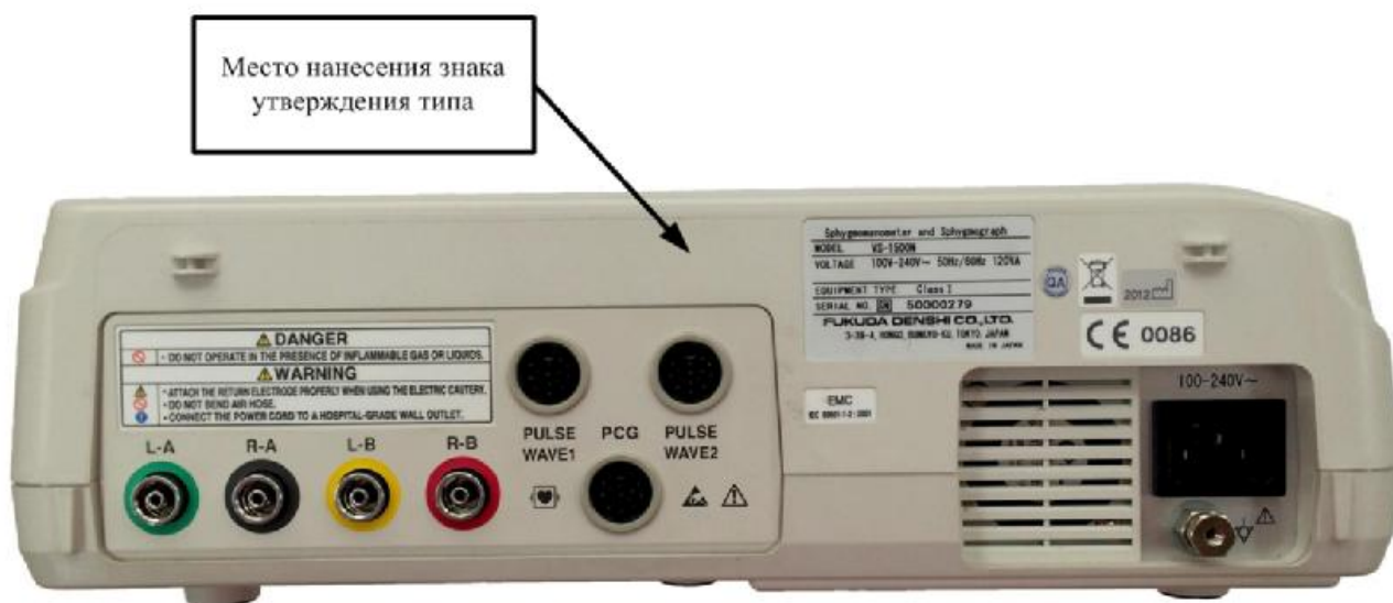
Рисунок 2 - Задняя панель сфигмометра