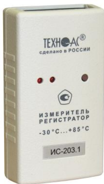
Рисунок 1 - Фотография общего вида прибора ИС-203.1.0 (1)