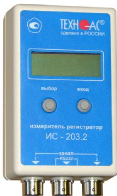
Рисунок 2 - Фотография общего вида прибора ИС-203.2