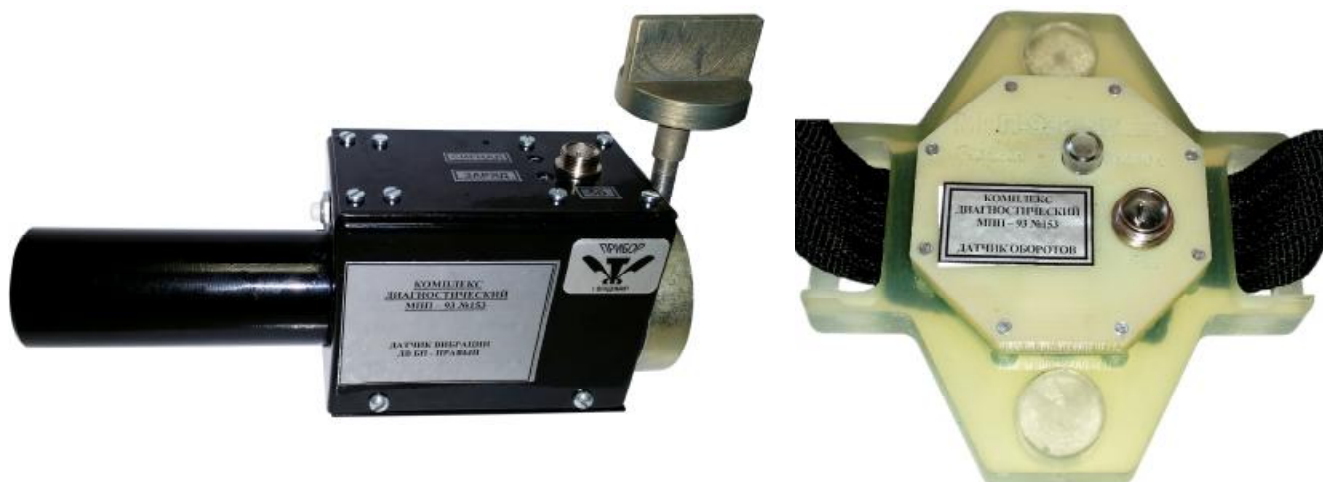
Датчик вибрации ДВ БП