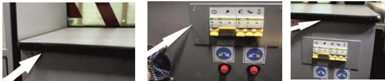
Рисунок 2 - Место для пломбирования узла управления, сбора и обработки данных комплексов

В целях предотвращения несанкционированного доступа к элементам регулировки комплексов предусмотрено место (на рабочем месте оператора) для размещения наклейки пломбирования, которое показано на рисунке 2.