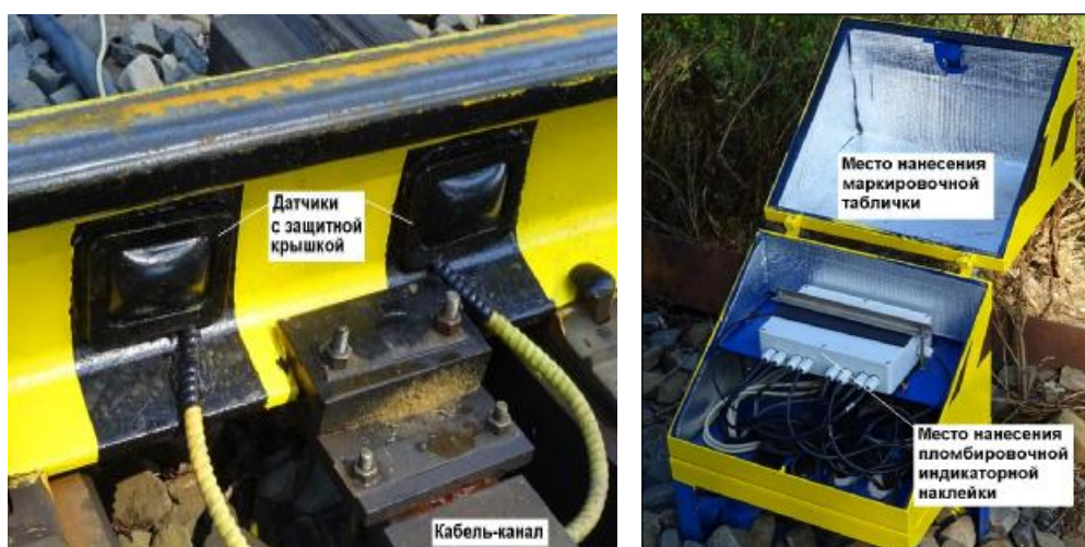
Рисунок 3 – Внешний вид датчика и шкафа контроллеров рельсовых датчиков