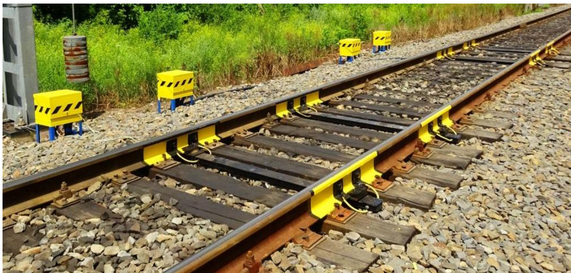
Рисунок 1 – Общий вид системы СЖДК.Р