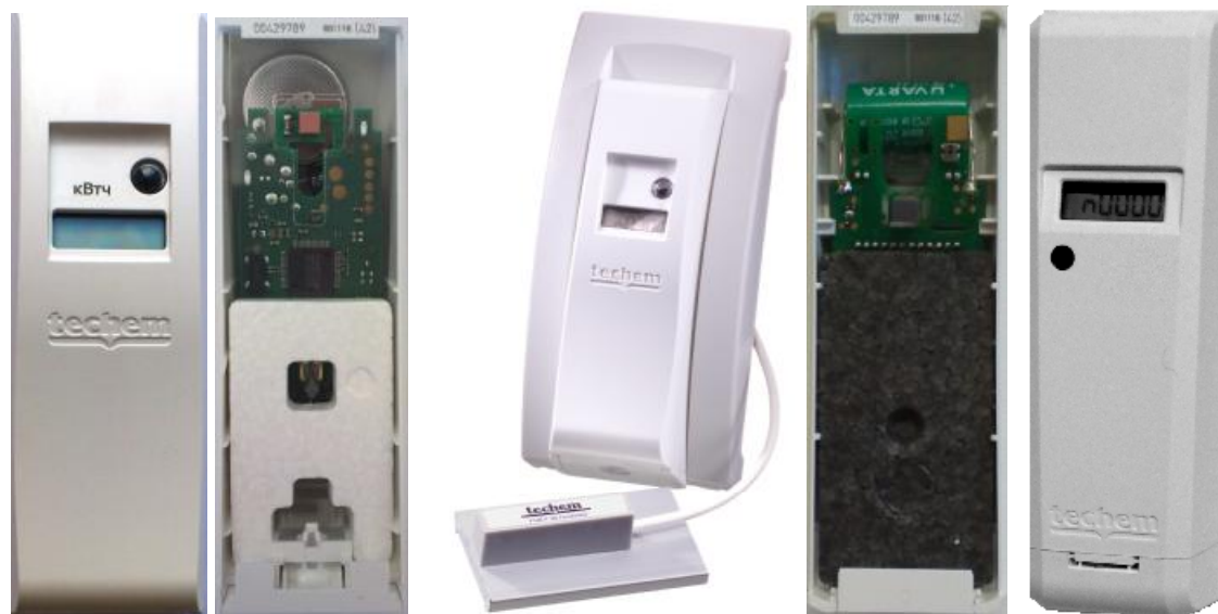
FHKV (мод. data III)

Общий вид устройств представлен на рисунке 1