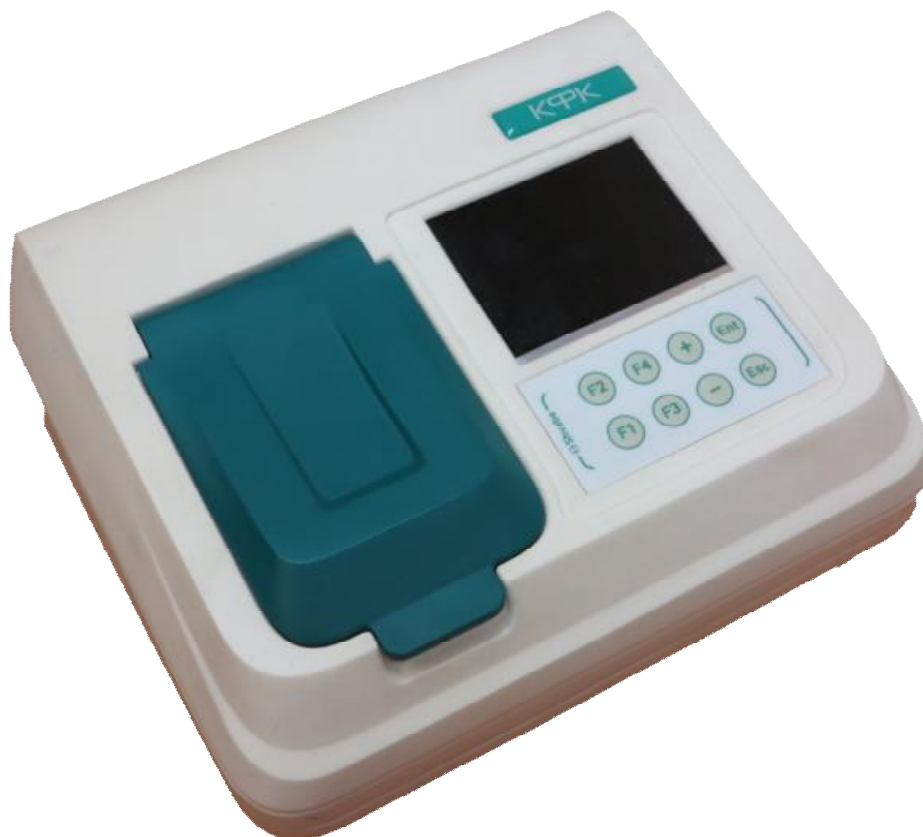
Рисунок 1 - Фотография общего вида фотометра КФК

Фотография общего вида фотометров представлена на рисунке 1. Схема пломбировки от несанкционированного доступа и место нанесения знака поверки изображены на рисунке 2.