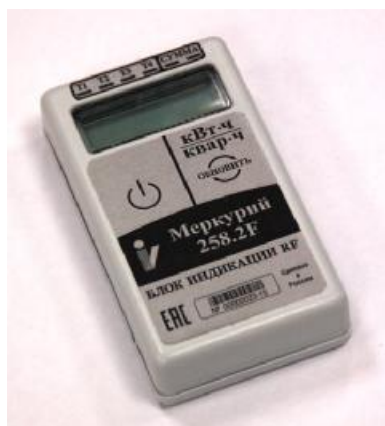
Рисунок 3 - Внешний вид блока индикации RF

Внешний вид блока индикации RF приведён на рисунке 3.