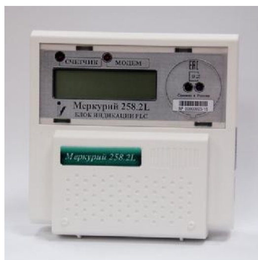
Рисунок 2 - Внешний вид блока индикации PLC

Внешний вид блока индикации PLC приведён на рисунке 2.