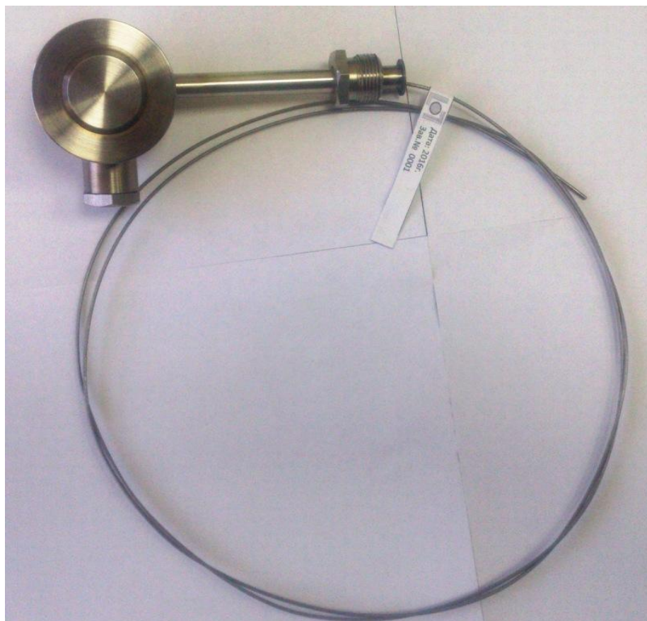
Рисунок 3 – Внешний вид преобразователей термоэлектрических кабельных КТХАС, КТХАСп, КТГХКС

Метрологические и технические характеристики приведены в таблице 1.