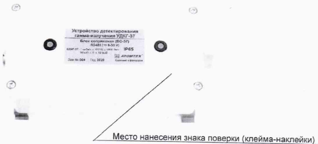
Рисунок 2 – Место нанесения знака поверки (клейма-наклейки)

Место нанесения знака поверки (клейма-наклейки) приведено на рисунке 2.