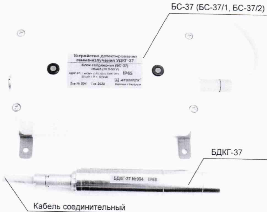
Рисунок 1 – Внешний вид устройств

Внешний вид устройств приведен на рисунке 1.