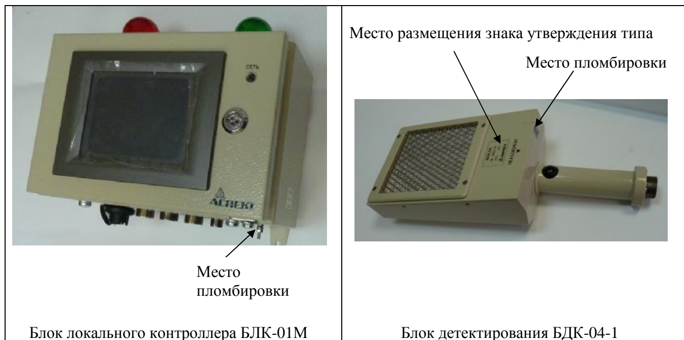
Рисунок 1 - Внешний вид составных частей установки РЗС-05А