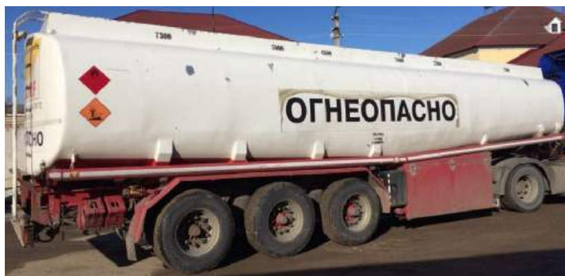
Фото 1 - Общий вид полуприцепа-цистерны ROHR TAL-A-DK40

На боковых сторонах и сзади ППЦ имеет надпись «ОГНЕОПАСНО», знак ограничения скорости и знаки с информационными табличками для обозначения транспортного средства, перевозящего опасный груз.