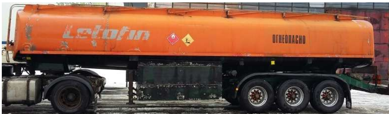
Фото 1 - Общий вид полуприцепа-цистерны SCHWINGENSCHLOEGEL

На боковых сторонах и сзади ППЦ имеет надпись «ОГНЕОПАСНО», знак ограничения скорости и знаки с информационными табличками для обозначения транспортного средства, перевозящего опасный груз.