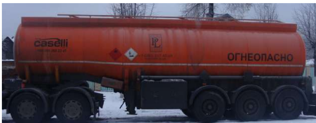
Фото 1 - Общий вид полуприцепа-цистерны CASELLI DMD012

На боковых сторонах и сзади ППЦ имеет надпись «ОГНЕОПАСНО», знак ограничения скорости и знаки с информационными табличками для обозначения транспортного средства, перевозящего опасный груз.