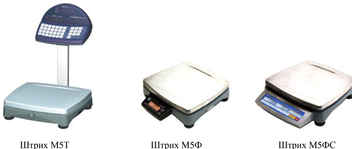
Рисунок 1 – Общий вид весов электронных Штрих М5

Общий вид весов всех конструктивных исполнений показан на рисунке 1.