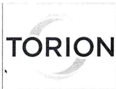
Рис. 1. Логотип ПО

После включения хроматографа появляется окно с логотипом ПО, представленное на рис. 1.