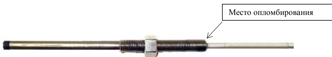
Рисунок 2 - Внешний вид вихретоковых датчиков серии 10000 (прямой монтаж)