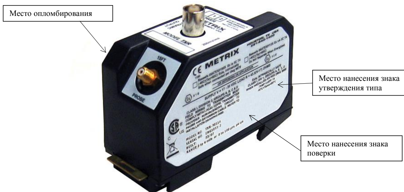
Рисунок 5 – Внешний вид трансмиттеров серий TXR, TXA