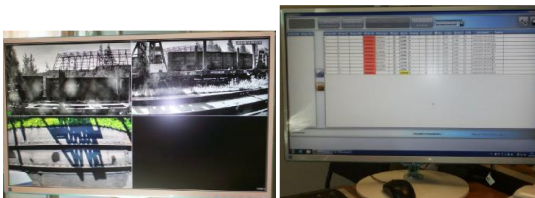
Рисунок 3 – Общий вид монитора ПК