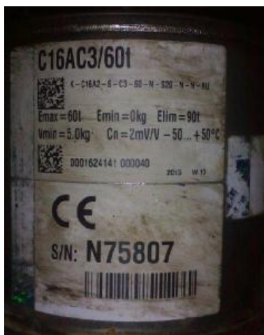
Рисунок 2 – Общий вид датчика C16AC3/60t