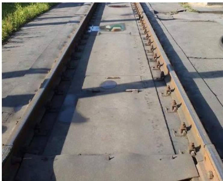
Рисунок 4 - Общий вид весов