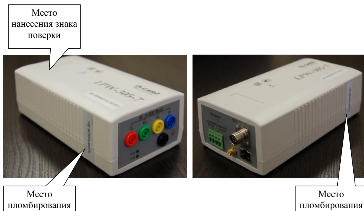
Рисунок 3 - Внешний вид измерителей портативного типа, места их пломбирования и нанесения знака поверки