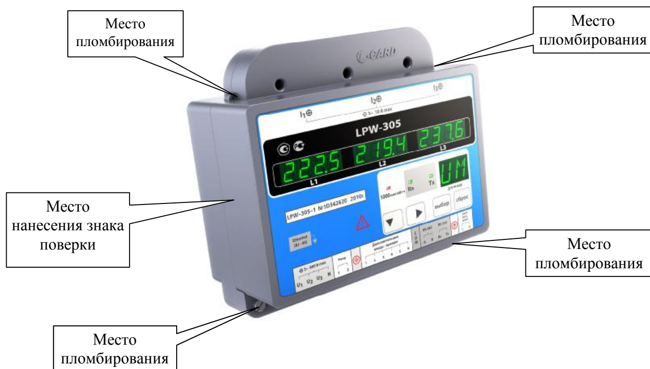
Рисунок 2 - Внешний вид измерителей с креплением на DIN-рейку, места их пломбирования и нанесения знака поверки