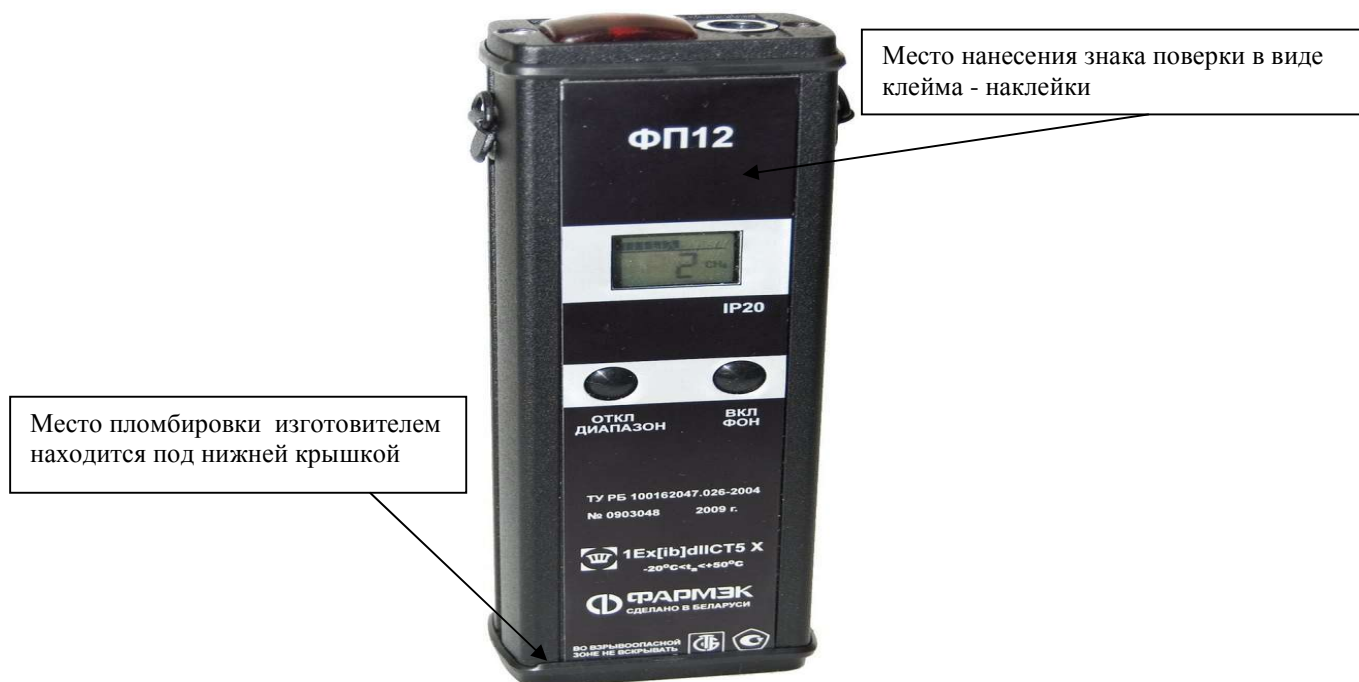
Рисунок 1 - Внешний вид течеискателя-сигнализатора ФП 12

Внешний вид течеискателя-сигнализатора ФП 12 приведен на рисунке 1.