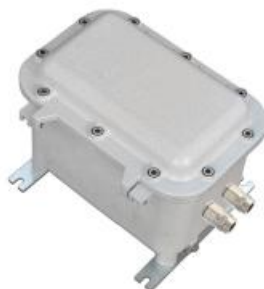
Рисунок 1 - Общий вид преобразователей ИПД ТК

Фотография общего вида преобразователя приведена на рисунке 1. На правой стенке преобразователя имеются штуцеры для подключения внешних трубок передачи давления с резьбовым соединением G3/8.