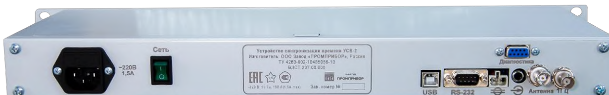
б) стоечное исполнение ВЛСТ 237.00.000, вид сзади