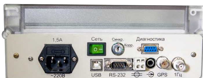
г) навесное исполнение ВЛСТ 221.00.000-04, вид снизу