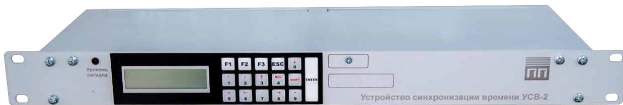
а) стоечное исполнение ВЛСТ 237.00.000, вид спереди