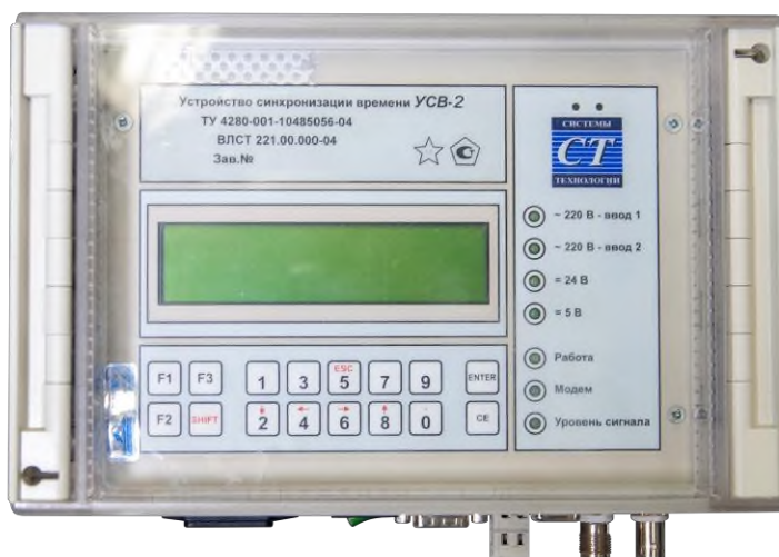
в) навесное исполнение ВЛСТ 221.00.000-04, вид спереди