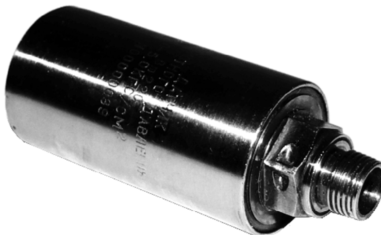
Рисунок 1 – Внешний вид датчика

Внешний вид датчика приведен на рисунке 1. Схема пломбирования от несанкционированного доступа – на рисунке 2. Габаритные и установочные размеры датчика представлены на рисунке 3.