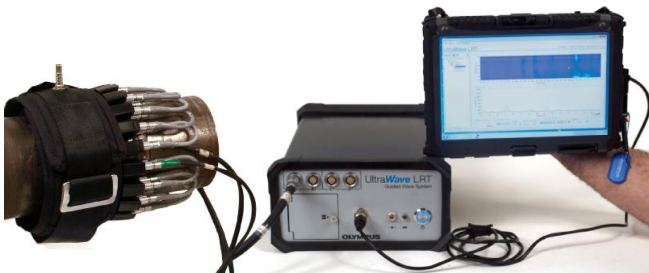
Рисунок 1 – Общий вид измерителей

Фотография общего вида измерителей приведена на рисунке 1.