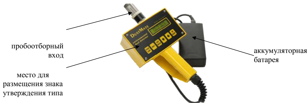
Рисунок 3 – Внешний вид анализаторов DustMate и обозначение места для размещения знака утверждения типа