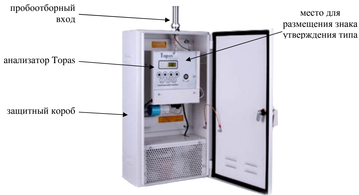
Рисунок 1 – Внешний вид анализаторов пыли Topas и обозначение места для размещения знака утверждения типа