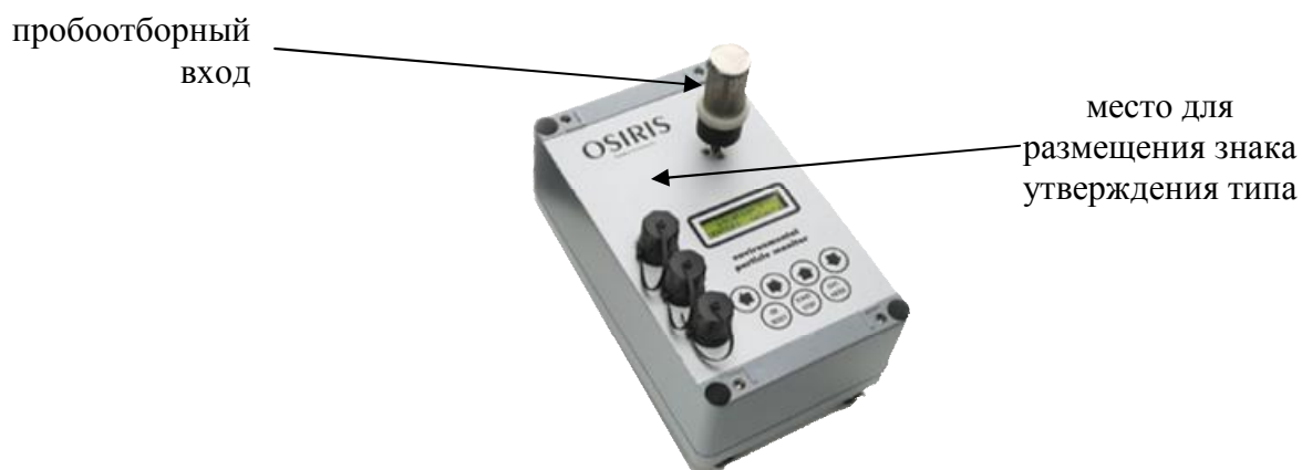
Рисунок 2 – Внешний вид анализаторов Osiris и обозначение места для размещения знака утверждения типа