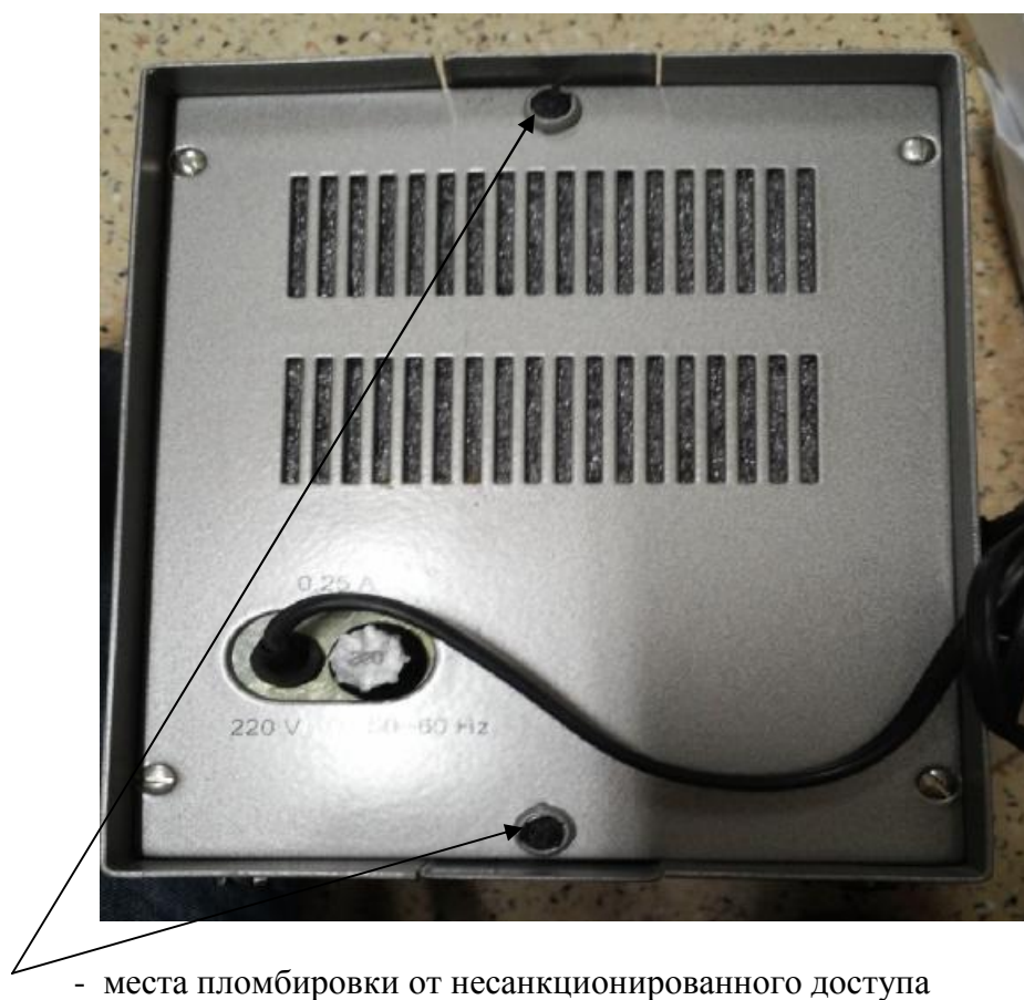
Рисунок 2 - Вид сзади частотомера