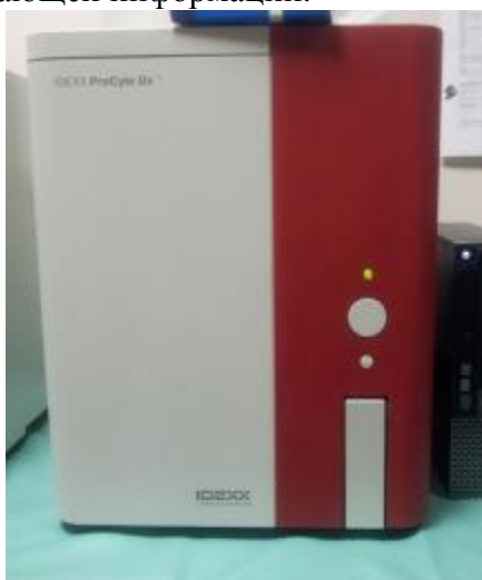
Рис. 1 – Анализатор ProCyte* Dx. Вид спереди.

Конструктивно состоит из самого анализатора, блока обработки информации (МПС), выполняющий обработку всех измерений и через который анализатор ProCyte* Dx подключается к вет-станции IDEXX VetLab, на котором происходит сбор и хранения всей поступающей информации.