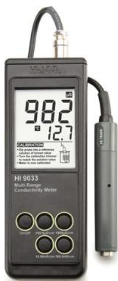
Рисунок 3 –анализатор HI 9033.