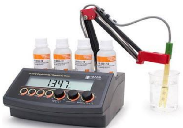
Рисунок 1 –анализатор НІ 2316.

Модификации анализатора различаются конструкциями используемого датчика и измерительного блока, метрологическими характеристиками, количеством измерительных каналов, а также видом исполнения (карманный, портативный, стационарный).