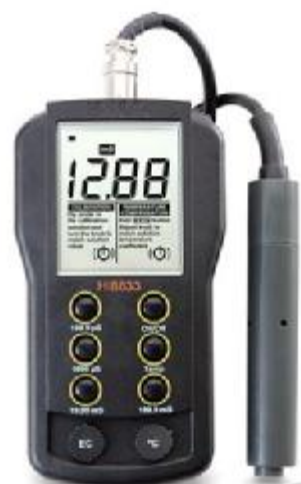
Рисунок 2 – анализатор НІ 8633