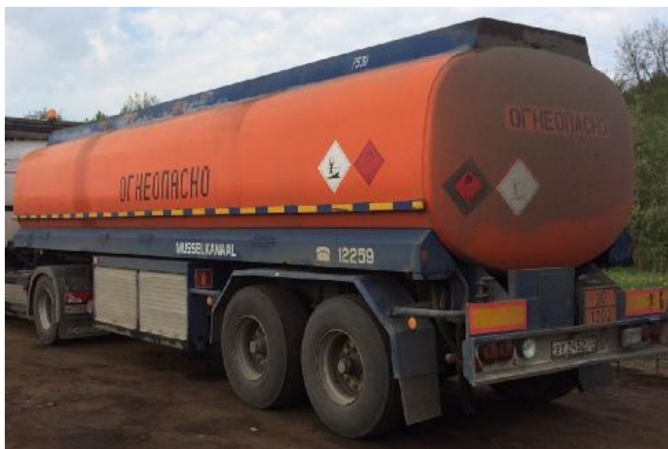
Фото 1. Общий вид полуприцепа-цистерны LAG ППЦ-32

На боковых поверхностях и сзади цистерн имеются надписи «Огнеопасно» и знаки с информационными табличками для обозначения транспортного средства, перевозящего опасный груз.