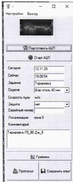
Рисунок. 2 - Окно регистратора опыта

6.3.1.4 Открыть окно регистратора опыта с помощью экранной кнопки «Регистрация» и в поле «Задание» записать команду «тарировка» (см. рисунок 2).